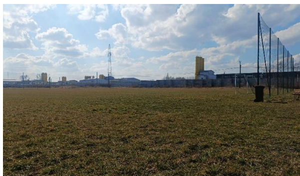
Fotografia 11 Stary Stadion Trzeboś