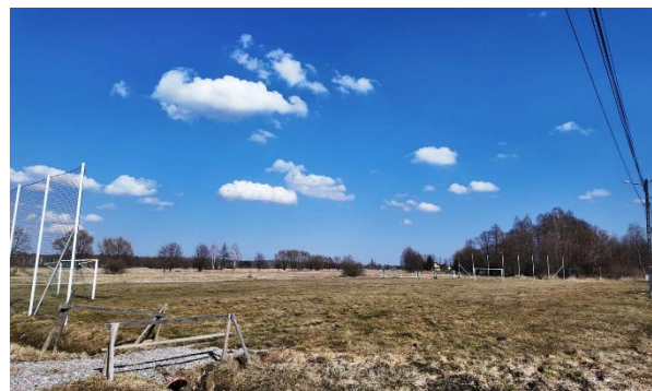
Fotografia 16 Boisko rekreacyjne przy ul. Leśnej