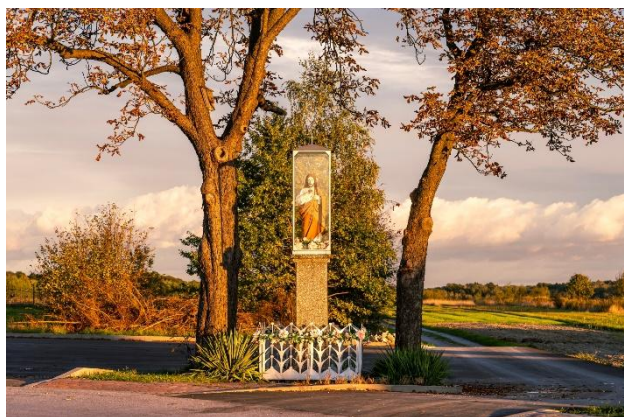
Fotografia 3 Kapliczka przydrożna