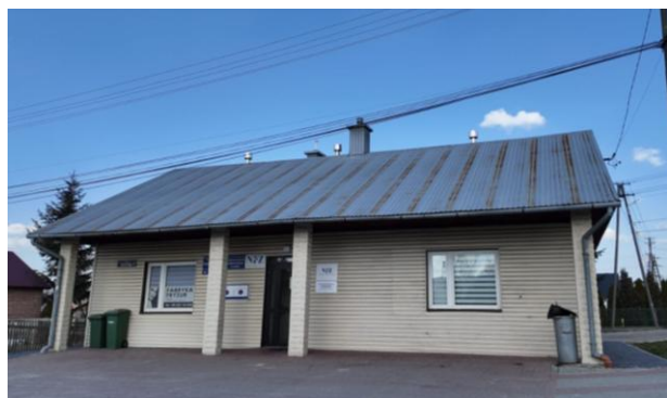
Fotografia 9 Dawny Ośrodek Zdrowia w Trzebosi