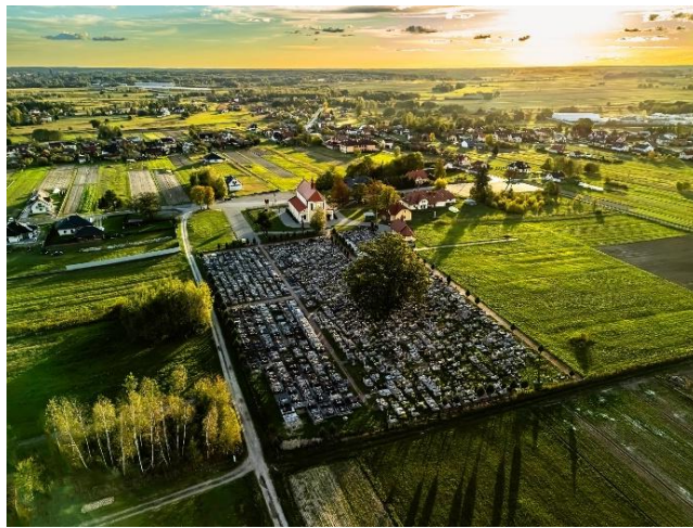
Fotografia 2 Widok na (nowy) cmentarz i kościół. Trzeboś