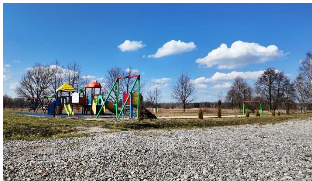
Fotografia 17 Plac zabaw przy ul. Leśnej