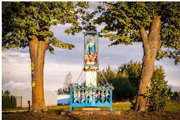
Fotografia 4 Kapliczka przydrożna