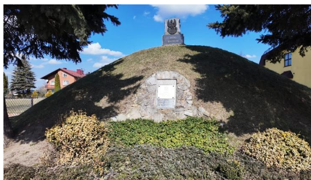
Fotografia 14 Kopiec Niepodległości w Trzebośi