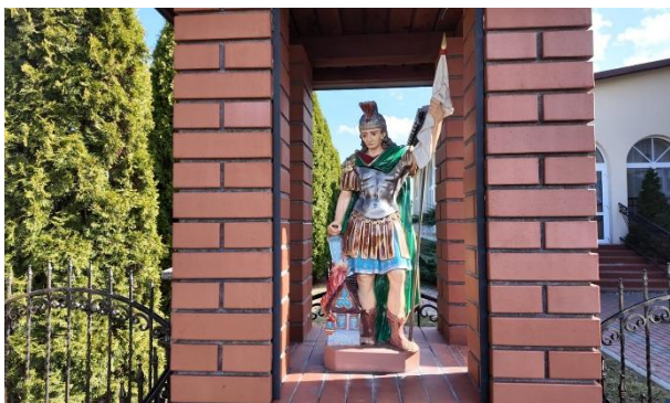
Fotografia 8 Św. Florian przy Remizie OSP Trzeboś