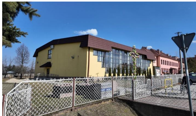
Fotografia 5 Zespół Szkół w Trzebosi