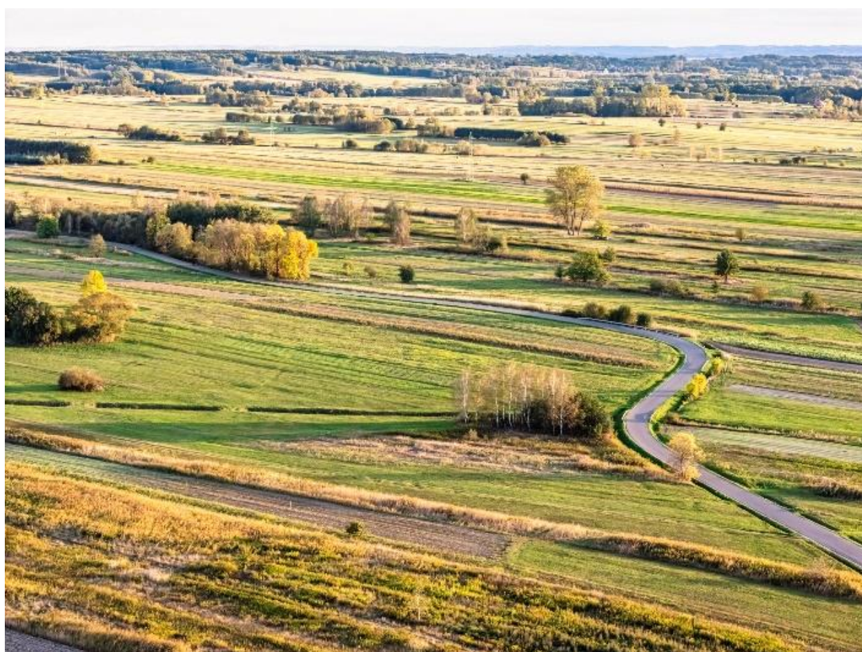
Fotografia 13 Krajobraz z lotu ptaka, Trzeboś