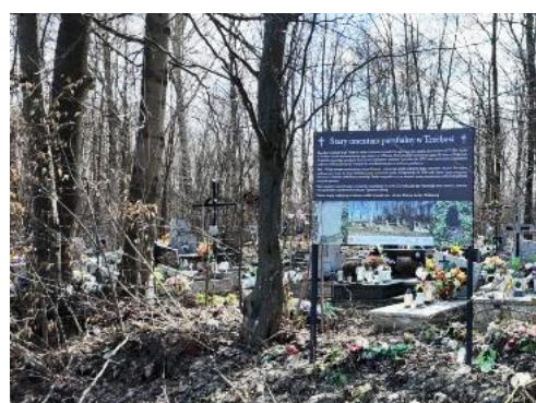
Fotografia 15 Stary cmentarz w Trzebośi