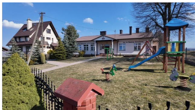
Fotografia 6 Szkoła Podstawowa Nr 3 w Trzebosi