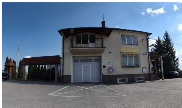
Fotografia 7 Remiza OSP Trzeboś