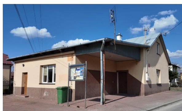
Fotografia 10 Świetlica Wiejska, Filia MGOKSiR w Trzebosi