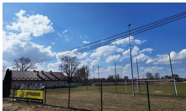
Fotografia 12 Stadion KS Styrobud Trzeboś oraz Biblioteka Gminna