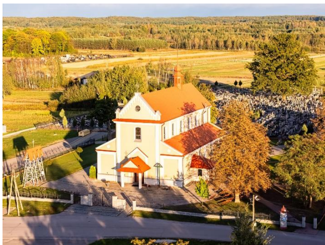
Fotografia 1 Kościół Parafialny w Trzebosi